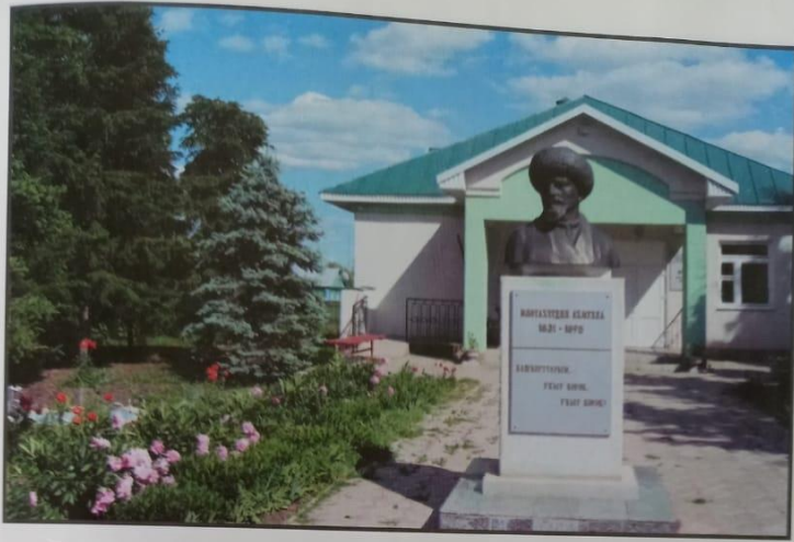
Тукханбай ауылындағы М.Акмұлла музейы